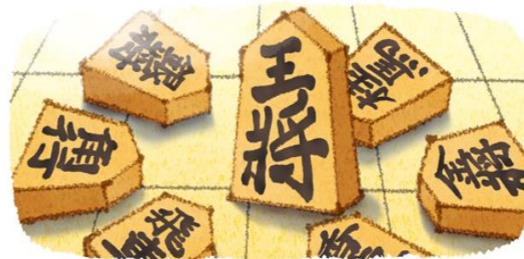
天童将棋駒 山形県